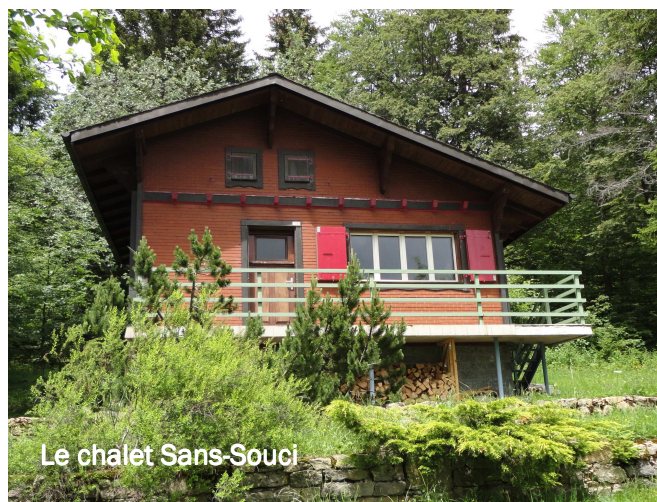
Le chalet Sans-Souci

Repas de famille, anniversaire, sortie de sociétés, entre amis, séjour « au vert », voici deux lieux à disposition de la population et des écoles de notre région. Vous avez dit école ? En effet, « Sous la Roche » se situant à moins de deux heures à pied (15 minutes en voiture) du centre de Gimel, les classes y sont les bienvenues pour passer un jour en pleine