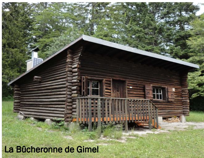
La Bûcheronne de Gimel

L'un et l'autre prennent place sur la même courbe de niveau à 1'260 mètres. Pour les férus de cartes topographiques et de GPS, les coordonnées géographiques sont les suivantes: Bûcheronne de Gimel 510'766/155'630; Chalet Sans-Souci : 510'466/155'595.