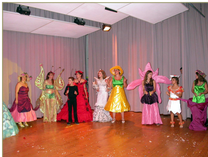
Vendredi soir: magnifique spectacle de nos amis français