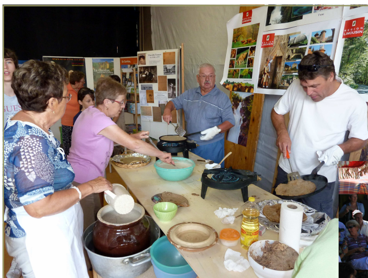
Gimelois et Gimelans à la Fête au village