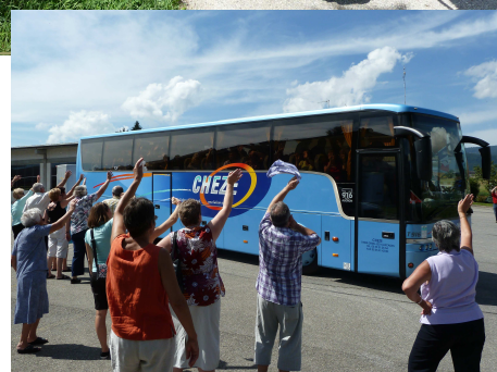
Pour le retour en Corrèze, changement de montures