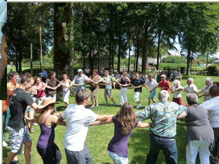
Après la fondue du dimanche, quelques pas de danse.